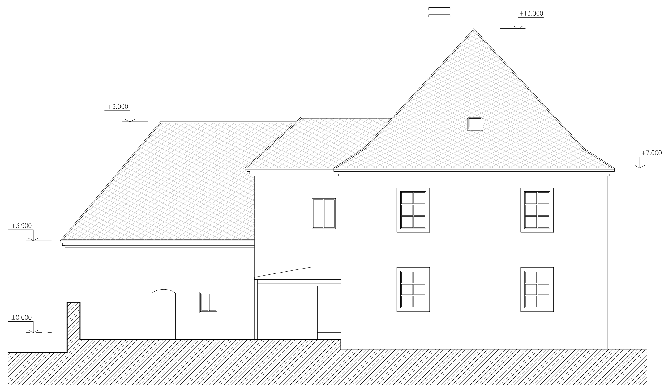
POHLED Z JHOZÁPADU