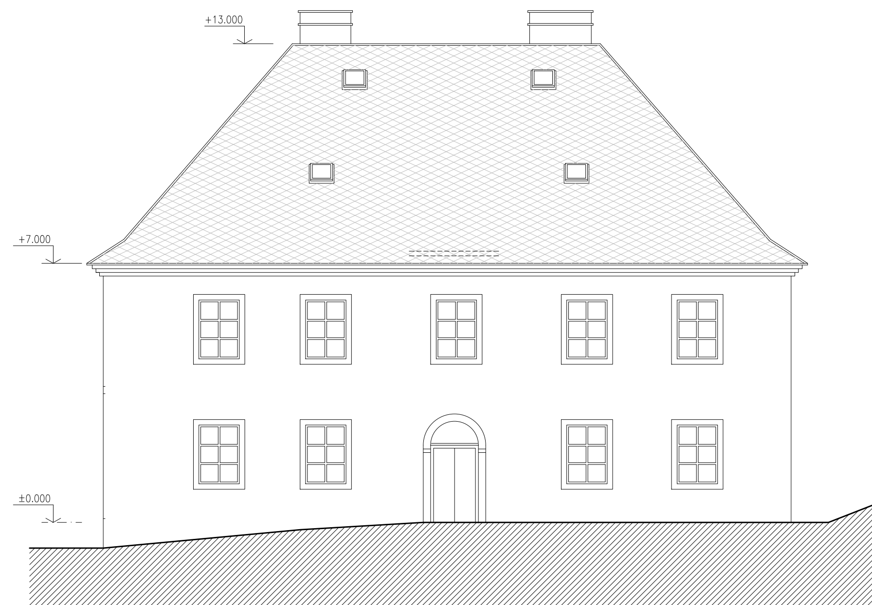
POHLED Z JHOVÝCHODU