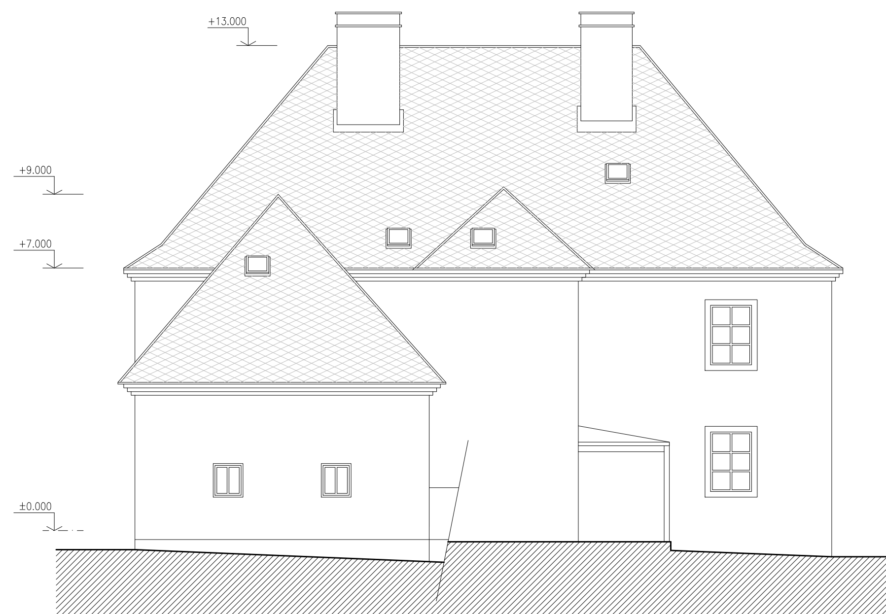
POHLED ZE SEVEROZÁPADU

POZNÁMKY: VEŠKERÉ UVEDENÉ ROZMĚROVÉ ÚDAJE JE PŘED REALIZACÍ NUTNÉ OVĚŘIT.